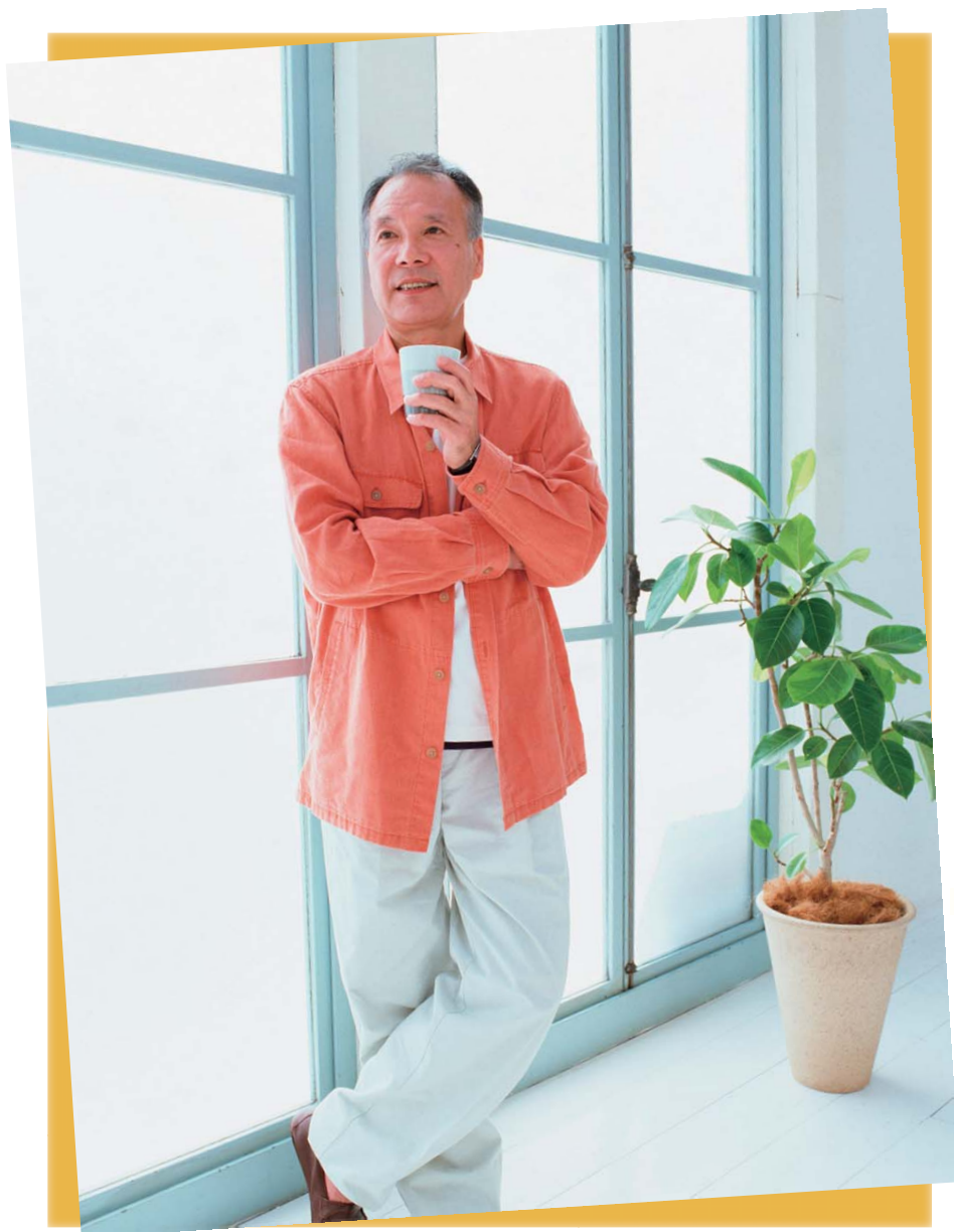
写真は生活のイメージです

札幌市豊平区月寒東5条6丁目1-5 交通・買物・利便性 良好です 地下鉄東西線「南郷7丁目」駅より 徒歩13分